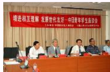
18日に中国人民大学で開かれた中日青年学生座談会

http://japanese.cri.cn/151/2007/06/20/1@96240.htm