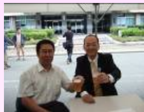
農学部同窓生との乾杯