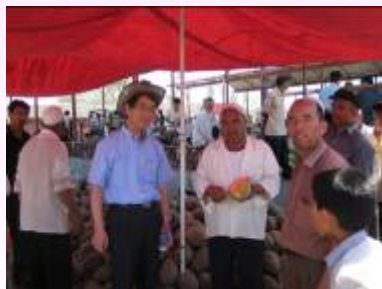
瓜卸売り市場考察