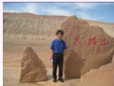
火炎山の70度の熱さ 体験